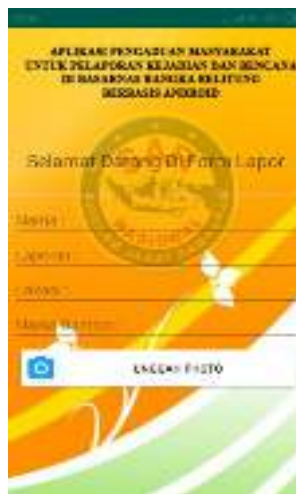
Gambar 6. Tampilan Layar Data Laporan Pengaduan Masyarakat