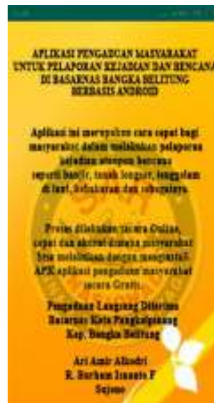
Gambar 9. Tampilan Layar Menu Tentang