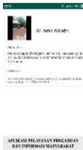
Gambar 8. Tampilan Layar Informasi Balasan Laporan Pengaduan