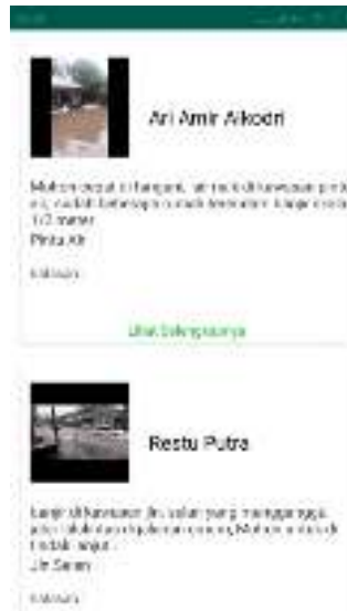
Gambar 7. Tampilan Layar Informasi Laporan Pengaduan