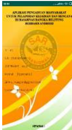
Gambar 5. Tampilan Layar Data Masyarakat