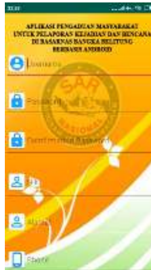
Gambar 3. Tampilan Layar Daftar